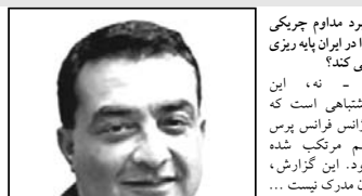
نبرد مداوم چریکی که در ایران پایه ریزی می کرد؟