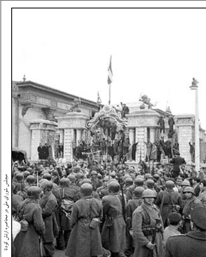
مجلس شورای ملی - محاسن امرداد ماه

افشای اسناد سازمان «سیا» درباره کودتای ۲۸ مرداد ۱۳۳۲ با «پروژه آژاکس» که در سال ۲۰۰۰ در روزنامه نیویورک تایمز منتشر شد ، برخی از زوایای پنهان این ماجرا را برای محققان آشکار ساخت . در آن سند به ارتباط برخی از اعضای سازمان سیا با افراد دره بالای ارتش ایران در جریان کودتا اشاره شده بود . اخیرا