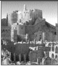
ارگ بم - کرمان

ای خداوند جان و خرد تنها با نیروی خرد و بینایی دل است که می توان به سرچشمه راستی که پروردگار است ، رسید ، نعمتی که در پرتو آن راستی و درستی در افزایش خواهد بود . یسنای ۲۳/۹