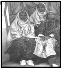
زنان زرتشتی قرن ۱۹

آن دو نیروی هم زادی که در آغاز در اندیشه آدمی پدیدار شدند، یکی «سینتا مینو» یعنی نیکی در اندیشه و گفتار و دیگری «انگره مینو» یعنی بدی در اندیشه و گفتار و کردار است. از میان این دو، نادان نیکی را بر می گزیند و نادان بدی را. نخستین سخنان اشوزرتشت به مردم، سیسی ۳۰، هات (۳ گاتها)