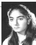
نوزدهمین دوره پیکارهای فوتبال جام شادروان میترا زره پوش از ۱۴ خرداد ماه به مدت چهار روز در زمین ورزشی همایشگاه مارکار تهرانپارس برگزار

در این پیکارها را ندارند. می شود. به گزارش خبرنگار امرداد: این پیکارها به صورت دوره ای انجام می شود و در صورت کم بودن تعداد تیم‌های شرکت کننده پیکارها به صورت حذفی انجام می یابانوان به یادواره ی شادروان آناهیتا شود. در این پیکارها هر تیم شامل ۱۰ بازیکن است و تنها ۵ بازیکن به این گزارش می افزاید: مهلت پایانی تحویل اسامی بازیکنان ساعت ۷ پسون ۳ خرداد ماه است و قرعه کشی در همان زمان و برای تشکیل این یگان در این حضور کلیه سرپرستان در زمین ورزشی همایشگاه مارکار انجام می شود.