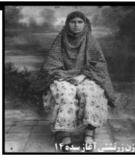
زینر زشتی (آغاز سده ۱۲)

شماره ۸ | صفحه ۸ | دوره جدید شماره ۸ | شماره مسلسل ۹۸ | چاپ دوم | انتشار ماه آشناسید و امرداد ماه ۲۷۴۰ | سه شنبه ۱۰ | امرداد ماه ۱۳۸۱ | کتشمه ۷۵۰۰ ریال