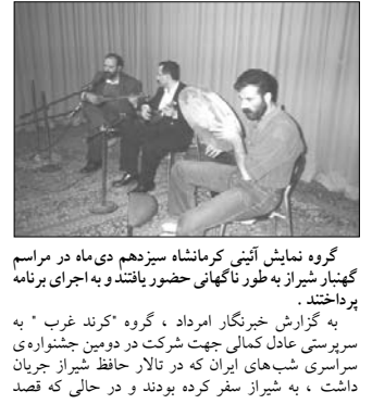
گروه نمایش آئینی کرمانشاه سیزدهم دی ماه در مراسم گنهار شیراز به طور ناگهانی حضور یافتند و به اجرای برنامه پرداختند.