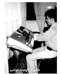
عکس از آرمنیا خوشرو