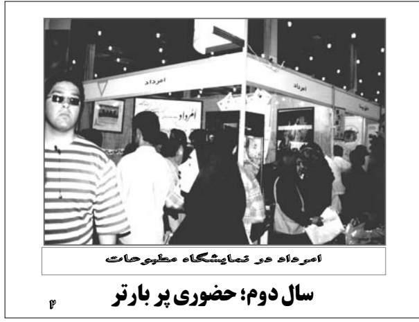
امرداد در نمایشگاه مطبوعات