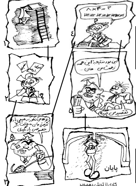
کاری از تریلی دهمدید