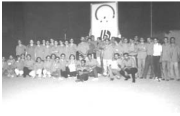
تیم‌های برتر در مراسم اهدای جام تابستان امسال در ورزشگاه آزادی